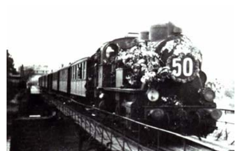
50 Jahre HHE- Zug bei Ausfahrt Bhf. Kloster