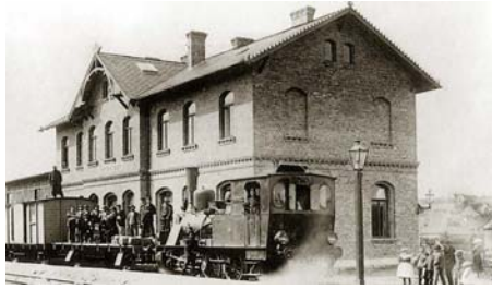
Gerbstedt um 1900