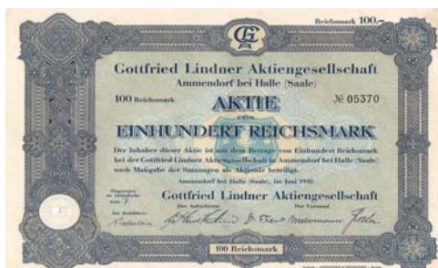
Aktie der Gottfried Lindner Werke von 1930

Nach dem 2. Weltkrieg wurde die Gottfried Lindner AG liquidiert und eine sowjetische Gesellschaft als Eigentümer eingesetzt. Ab 1947 begann hier die Entwicklung eines 4-achsigen Personenwagens, der der Urvater von fast 30.000 Reisezugwagen für die Sowjetunion war und bis 1999 gefertigt wurde. Seit 1996 erfolgte u.a. der Ausbau von Mittelwagen und Triebköpfen für ICE. Heute ist der Waggonbau Ammendorf einer der letzten verbliebenen Großbetriebe der Metallindustrie in der Region Halle und die älteste noch produzierende Waggonbau-Fabrik in Deutschland.