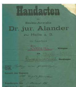
Der Gerichtsfall „Mühle“